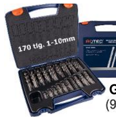
Großer HSS-G-Koffer 170-tlg. 1-10mm - Preis: nur 99,00 € (900.0173K)

Aktuelle Sonderkonditionen für unsere Kunden!